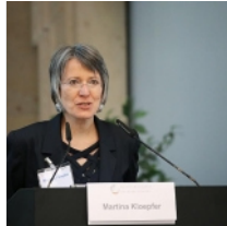
Zur Artikelübersicht Zur Startseite